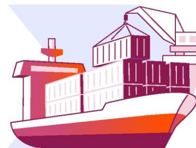
Destinatari finali (în transportulmaritim)