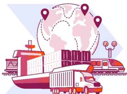
Transportatorii care operează pe căi navigabile maritime și interioare, rutiere și feroviare