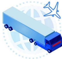
freight forwarders 1