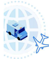
Serviciu de curierat rapid