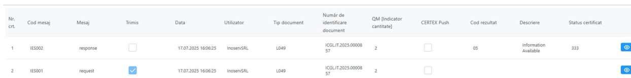
Figura 3 - Mesaje Certex Declarant/Reprezentant

Raspunsul CERTEX („CertexInformationResult” in mesajul XML IES002), la nivel de declarant/reprezentant poate fi: